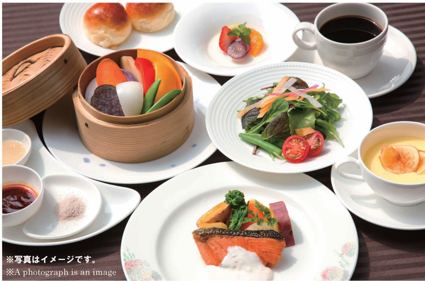
※写真はイメージです。 ※A photograph is an image